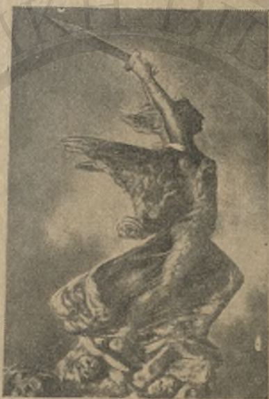
Ἐλευθερία ἔργον γλύπτου Γιάννη Καρακάκη