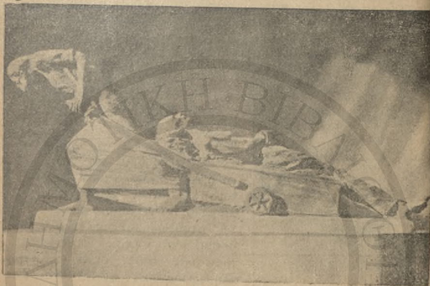
Κηδεία 1941 έργον Καναζάκη