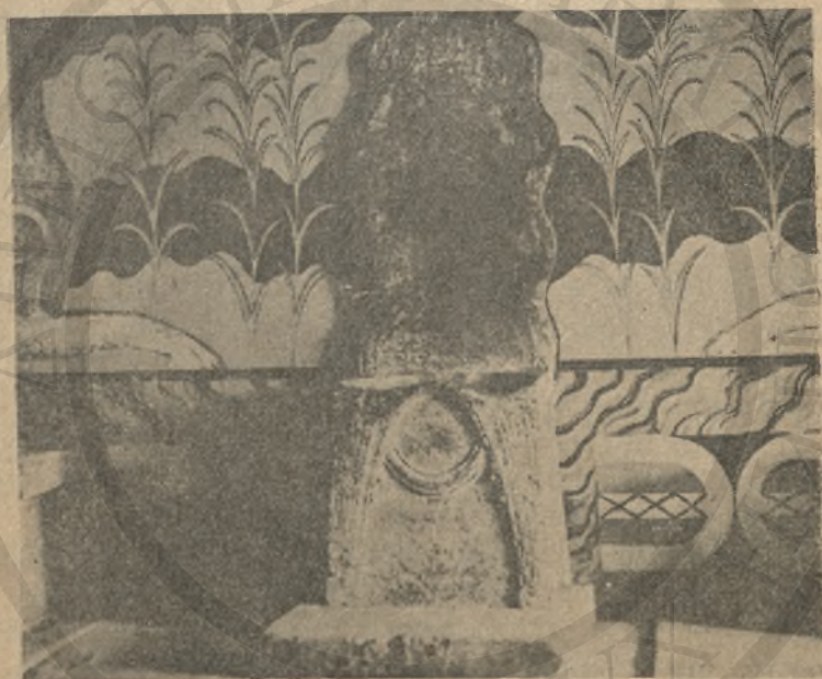
Κνωσσός. Ὁ θρόνος τοῦ Μίνωος.