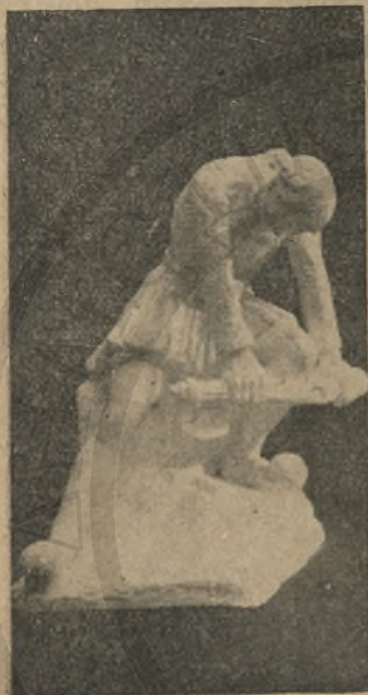
Ὁ εὐζωνας πὸν σπᾶ τὸ ἰταλικὸ φάτιο.