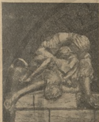
Ἡ θνήσκουσα μητέρα ἔργον Κανακάκη

ταῦτα διασκεδάζει τῇ λύπῃ του κι' ἐλπίζει εἰς ἓνα καλλί- τερο αὔριο. Δι' ἓνα Κωνσταντινουπολίτη ἡ ζωὴ εἶναι πάρα πολύ ἀκριβή, τὸ χρῆμα ἀφθονο σὲ βαθμὸ πού δὲ μπαίνει στὸ συρτάρι ἢ πορτιμονὲ καὶ γι' αὐτὸ τὰ περισσότερα μα- γαζιὰ ἔχουν πανιέρια στὰ ὁποῖα βάζουν τὲς χιλιάδες δραχ-