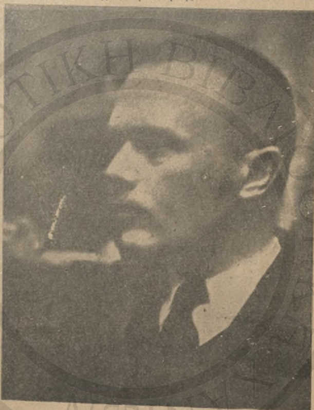
Ἐξοχώτατος Σοφοκλῆς Βενιζέλος Ἕλλην Πρωθυπουργός

Τὸ 1911 ὅταν ἤμην μαθητὴς στὸ λύκειον ὁ Κοραῆς