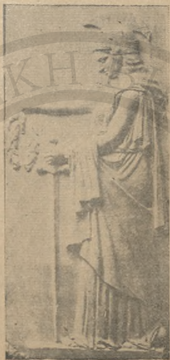
Ἡ Ἑλλὰς καταθέτουσα στέφανον εἰς τοὺς ἐκτελεσθέντας ὑπὸ τῶν Γερμανῶν Ἔργον γλύπτου Γιάννη Κανακάκη