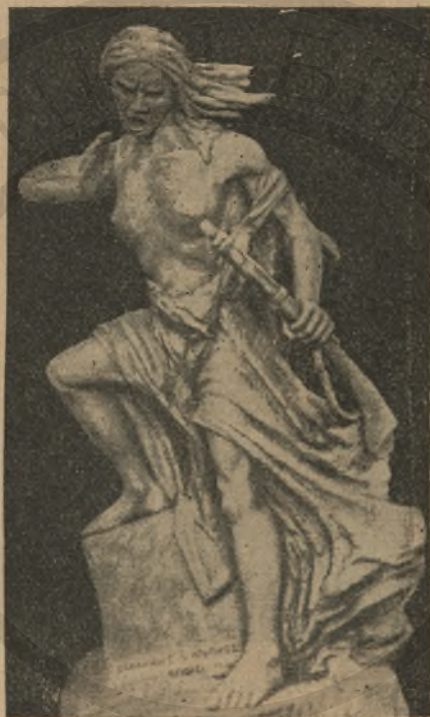
Ἐξέγερσις Κρήτης 1941