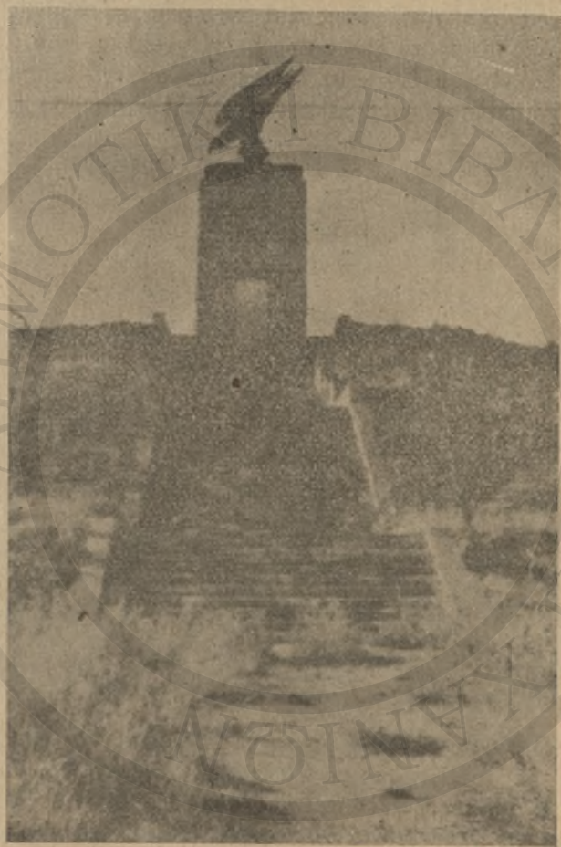
Τὸ γερμανικὸ μνημεῖο τοῦ Μακρὸν Τοίχου

λοξένησε στ' άρχοντικό του σπῆτι, παίξαμε τῆ λύρα, τραγουδήσαμε Κρητικά τραγούδια, έφάγαμε άμέτρητα φαγητά, έπιαμε ειδῶν ειδῶν ποτά. Στὸ σπῆτι ἦλθαν καὶ ἄλλοι χω-