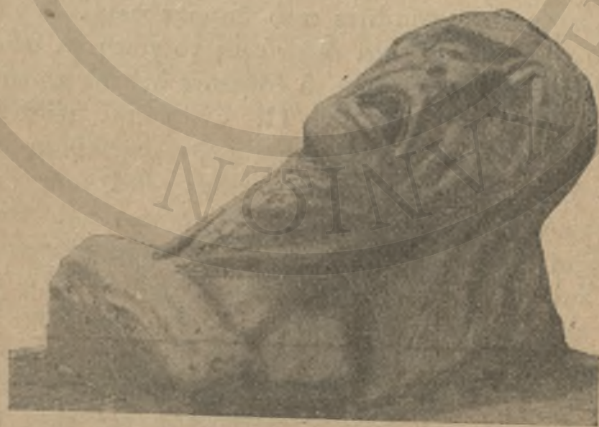
Η πείνα 1941 έργον γλύπτου Καναζάκη