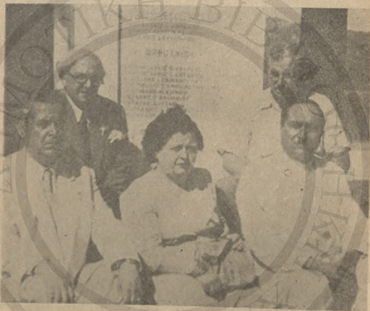
Ὁ συγγραφεὺς με τοὺς φίλους του στὸ Μανσωλεῖο Κερίτη.

γαζαδέ, χωράφια, έλαιόφυτα και κήπους φθάσαμε στο Κερίτη, στο μέρος στο οποίο έπρεπε να χυθῆ τὸ αἷμα τὸ ἥρωϊκὸ τῶν Κρητῶν, ἐπειδὴ ἤθελαν νὰ ὑπερασπίσουν τὴ πατρίδα των καὶ τὸ σπῆτι των. Ναί, αὐτὴ ἡ κατηγορία τοὺς ἐβάρυνε διότι ὡς ἄοπλος πληθυσμὸς ἐξεστράτευσαν ἐναντίον τῶν Γερμανῶν ἀεροπόρων, πρᾶγμα τὸ ὁποῖο ἀπα-