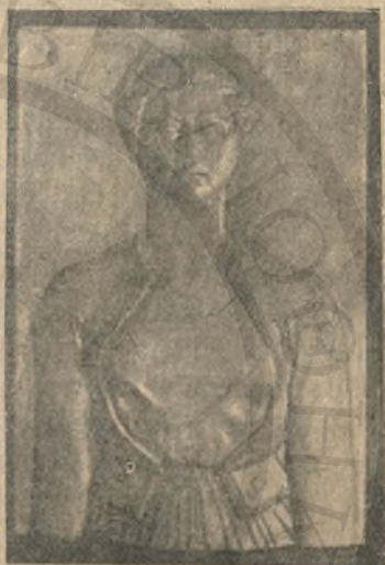
Τύπος Κρητικοπούλας. Ἔργον Κανακάκη

Ἀπὸ τῆ Πισκοπὴ μῆκε κάποιος γιατρὸς πὺ θὰ πῆ- γαινε σ' ἓνα ἄλλο χωριὸ γιὰ τὸ τοκετὸ μιᾶς γυναίκα. Βοήκα τὴν εὐκαιρία νὰ τοῦ ἐξιστορήσῃ ἓνα περιστατικὸ πὺ μούχε πῆ κάποτε ἓνας γιατρὸς τὸ ὁποῖο δὲ τὸ εἶχα καλοπιστεύσει. Τὸν προσκάλεσαν σ' ἓνα σπῆτι χωριάτικο τῆς Ἀνατολῆς πὺ ἐγκυμονοῦσε μιὰ γυναίκα, πῆγε εἶδε ἐκεῖ καὶ τῆ πρακτικὴ μαμμὴ τοῦ χωριοῦ τὴν ὁποία ἀρώτησε πῶς πάει ἡ ἐγκυμονοῦσα. «Ἐξετάσετε τὴν καὶ πέστε μου» ἀπήντησε ἡ μαμ- μῆ. Ὁ ἱατρὸς ἐξετάζει τὴ γυ- ναίκα καὶ βλέπει ὅτι τὸ παιδὶ κατεβαίνει λάθος δηλαδὴ μὲ τὰ ποδαράκια, τὸ ὁποῖο κατὰ τὴν ἐπιστῆμη εἶναι σοβαρό. Τὸ λέει τῆς μαμμῆς ἡ ὁποία ἀπαντᾷ ὅτι αὐτὸ εἶναι εὐκόλο καὶ δὲν ἀξίζει ν' ἀνησυχῆ ὁ ἱατρὸς. Ἡ μαμμὴ βγάζει ἀπὸ τὸ μλόγο τῆς πὺ ἦτο γεμάτος κομποδέματα, ἓνα κομποδέμα πὺ εἶχε κάτι χόρτο τὸ ὁποῖο βράζει ὅπως τὸ τσαῖ καὶ τὸ δίδει τῆς γυναίκας νὰ τὸ πιῇ. Μετὰ 5—10 λεπτὰ ἀφοῦ ἡ γυναίκα τὸ ἔπιε, τὴν ἔπιασαν κάτι σπασμοὶ δυνατοὶ πὺ μ' αὐτοὺς τὸ παιδὶ γύρισε κι' ἤρχισε νὰ κατεβαίνῃ μὲ τὴ κε- φαλή. Ὁ ἱατρὸς θαύμασε καὶ ὑπεσχέθη 50 χρυσᾶ στῆ μαμμὴ ἀρκεῖ νὰ τοῦ εἰπῆ τί εἶναι αὐτὸ τὸ χόρτο, ἀλλ' αὐτὴ δὲν ἐδέχτηκε. Αὐτὴ τὴν ἐξιστόρησι ἔκαμα στὸ Κρητικὸ γιατρὸ, ὁ ὁποῖος μοῦ εἶπε ὅτι εἶναι μιὰ μεγάλη ψευτιά γιὰ τὸ παιδὶ δὲν εἶναι δυνατό νὰ κάνῃ τοῦμπεσ στῆς μα- μᾶς του τῆ κοιλιά. Ἐνα poisson d' Avril φαίνεται μοῦ πούλησε ὁ Ἀνατολίτης γιατρὸς!