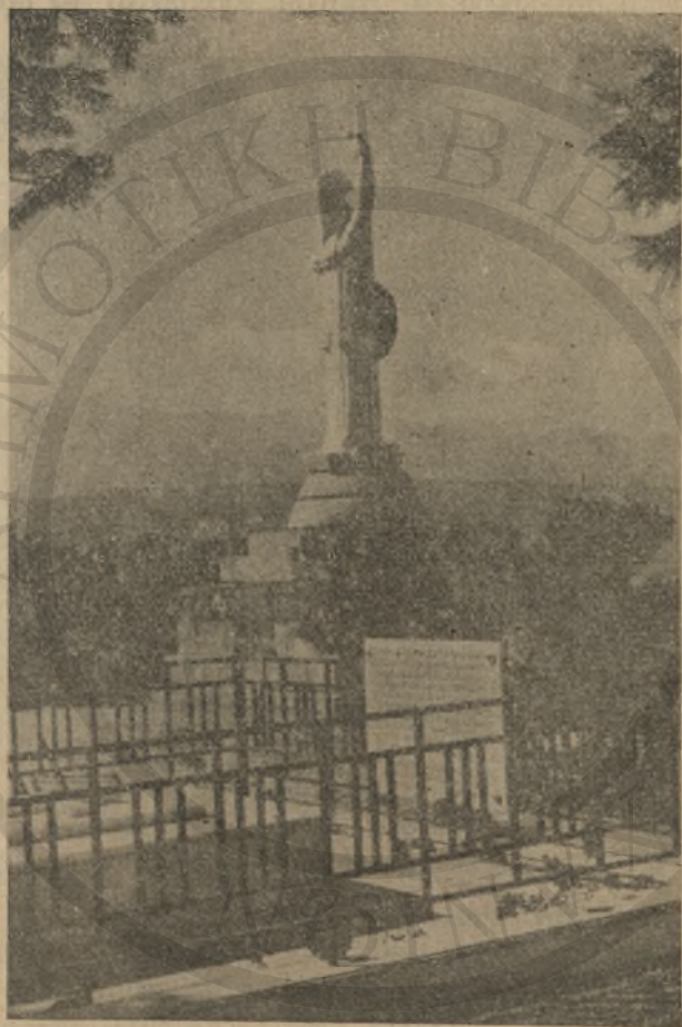
Ὁ τάφος τοῦ Ἐλευθερίου Βενιζέλου στὸ Ἀκρωτήρι

πού εἶχε μέσα του, κάθε δύναμιν ψυχικὴν καὶ σωματικὴν. Ἐπιτάφιος λόγος αὐτοεκφωνηθεὶς ἀπὸ τὸν προκείμενον νεκρὸν ἐν τῇ Βουλῇ τῶν Ἑλλήνων τὴν 28 Ἀπριλίου