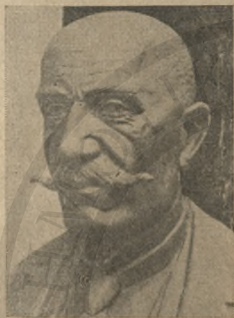
Προτομή άειμνήστου Κορνυ- λάκη πρωτοπόρου Κρητικού ήθογράφου.

άνθρώπους οί όποιοι θά σέ σέβοντο και θά σέ έκτιμοῦσαν και άντι όλα αυτά δι' άμοιβή σφαίρα! "Ας μείνη τό όνομα σου άθάνατο.