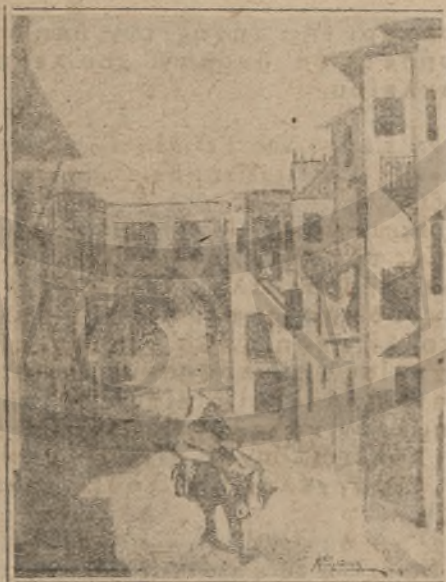
Ἀρόμος ἀπὸ τῆ Σπλάντζα Σανίων

Ἡ Ἡμισέληνος αἰρεται ἀπὸ ὅλα τὰ σημεῖα, ἐπὶ τῶν ὁποίων ὑφῆστο καὶ ἔκτοτε ἀνεπετάσθη καὶ ὑψοῦτο παραπλεύρως τῶν σημαίων τῶν τεσσάρων Δυνάμεων ἡ σημαία τῆς Κρήτης, ἀντὶ τῆς Τουρκικῆς, ἥτις ἀπεφασίσθη κατοχυρωμένη ἐκ λευκοσιδήρου νὰ κυματίζῃ ἐπὶ ἐνὸς σημείου τῆς νησίδος Σούδας εἰς τὴν εἰσοδὸν τοῦ ὁμωνύμου κόλπου