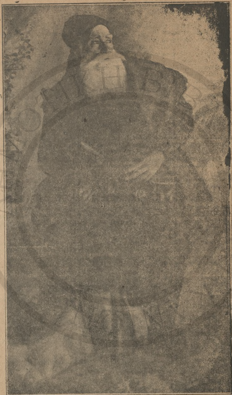
ΣΤΑΥΡΟΥΛΟΣ ΖΟΥΡΙΔΗΣ , δπλαρχηγός εκ Λάκκων Κυθωνίας, διακριθείς, ιδίως, κατά τους αγώνες τής Μεταπολιτευσεως. (Ίδε σχετικόν σημείωμα εις «Εξοιότητα Λάκκων» επαρχία; Κυθωνία; Νομός Χανίων.