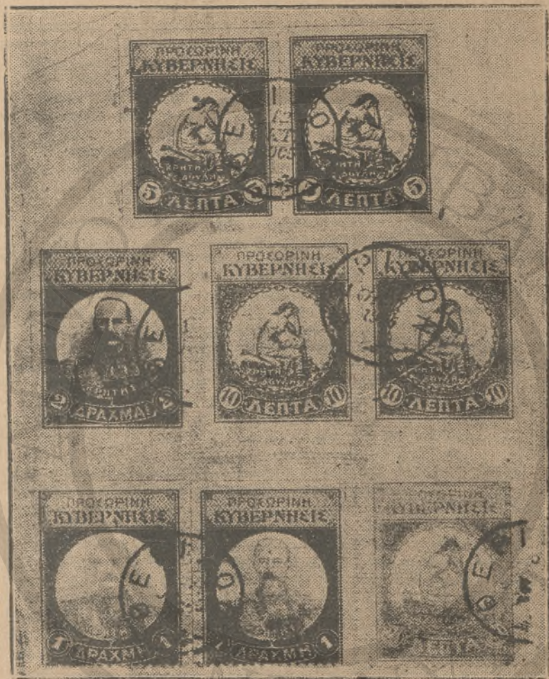
Γραμματόσημα τῆς Προσωρινῆς Ἐπαναστατικῆς Κυβερνήσεως τοῦ Θερίσου.

τῆς ἐθνικῆς Δυναστείας. Νομίζετε ὅτι ἐὰν ὄσον δὲν καθιερωθῆ ρητῶς ὑπὸ τῶν Κρητῶν ἢ ἐκλογῇ τοῦ ἀρχηγοῦ τῆς ἐκτελεστικῆς ἐξουσίας δὲν δύναται, ἐκλείποντος ἐξ ἐθνικοῦ τινος ἀτυχήματος τοῦ προσώπου τοῦ νῦν Ὑπάτου Ἀρμοστοῦ, νὰ προκύψῃ εἰς τὸ μέσον ἡ περιπέτεια τοῦ διορισμοῦ Ὑπάτου Ἀρμοστοῦ προσώπου μὴ παρέχοντος εἰς τὴν ἐθνικὴν συνείδησιν