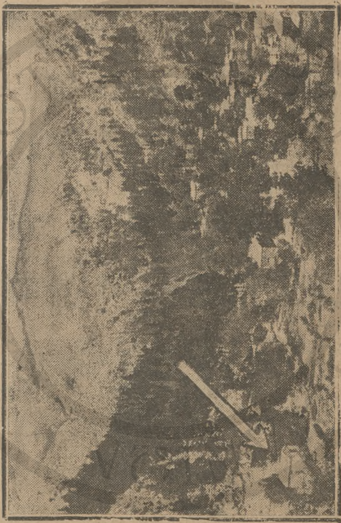
Τὸ ἰσχυρὸν Θέριον ὅπου ἐκπρυχᾶ τὴν κίνησιν. Μετὰ τὸ τέλος σημειοῦται τὸ σπῆγμα ποῦ ἐξερπίσσειεν ὡς ἀρχήν τῶν ἐπαναστάσεων.

ὅπου συγκροτεῖται ἡ συνάθροισις κατὰ τὰ ἐξημερώματα, δὲν ἦτο βε- βαιῶς ἔργον φρονήσεως. Ἀλλὰ καὶ ἡ περαιτέρω ἐνέργεια τοῦ διοικη- τὸς τὸ ἀπέσπασμα τῆς χωροφυλακῆς ὑπῆρξεν ἀτυχῆς, ὅτε τὸ δι-