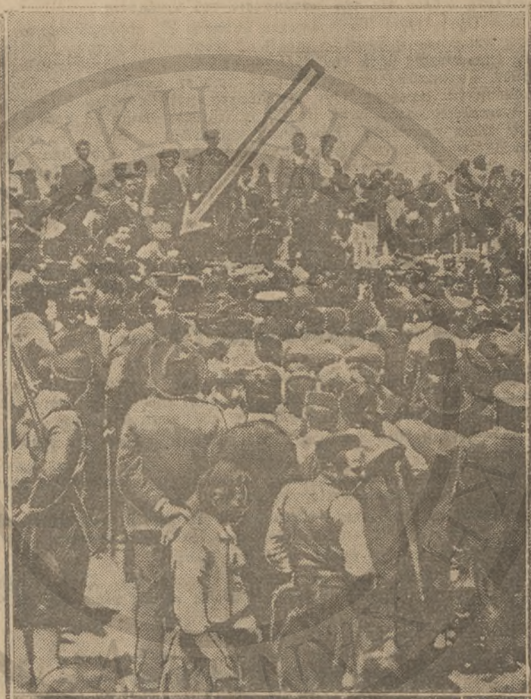
Μία ἱστορική φωτογραφία τῆς πρώτης συγκέντρωσης τῶν ἐπαναστατῶν τοῦ Θερίσου. Μὲ τὸ βέλος σημειοῦται ὁ Βενιζέλος ἀγορεύων πρὸς τοὺς ἐπαναστάτας.

«—Ὅττω λατὸν, αἱ Δυνάμεις, βλέπουσαι τὸν τόπον οὐδεμίαν ἄλλην λύσιν στέργοντα, θὰ συγκατανύσῃν, τέλος, νὰ παραχωρήσῃν τὴν ἑνωσιν.