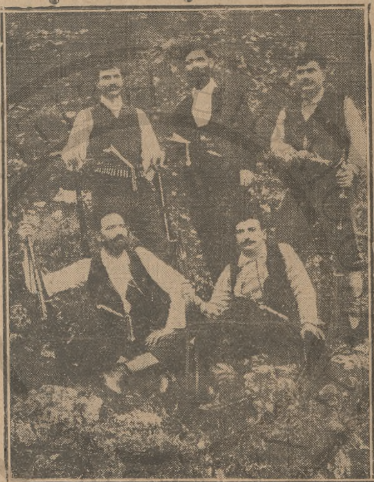
Οἱ ἄρχηγοὶ τῆς Ἀντεπανακτοῦσεως, ἡ ὁποία ὀργανώθη μετὰ τὴν ἁπτοχίαν τοῦ κινήματος τοῦ Θερῖου, διὰ νὰ ἐμποδίσῃ τὴν ἀνεχώρησιν τοῦ Πρίγκηπος Γεωργίου.

χωριοῦ. Ὁ Βασιλεὺς ἐξήγγισεν εἰς πᾶσιν χωρικοῖς τὸν σκοπὸν τῆς ἀφίξεώς του καὶ τοὺς ἠρώτησεν, ἂν ἴσταν διατεθειμένοι νὰ φιλοξενήσουν