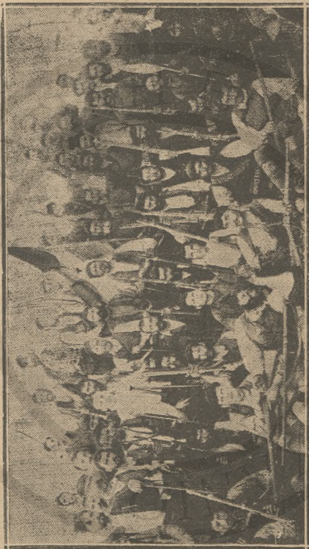
Ἐπισημὰ ἐπικρατοῦν τοῦ Θερίσου. Ὁ δια-σκαφεὺ ἀρμεύμενος εἶνε ὁ ἐκ τῶν ἀρμηγῶν τοῦ ἑ- μίλου Στρατοῦ Μιερτα, ἔπειτα, ἀφενεὺθι κατὰ τὰς συγκροσεῖς.

το...ὀχιλόδος. Μόνον τὸ ὑπουργετον τῶν Οἰκονομικῶν δὲν ἤθελε, διότι σκοπὸς τοῦ δὲν ἦτο πῶς γὰ διαρρυθμίσῃ τὰ οἰκονομικά τοῦ τόπου, ἀλλὰ πῶς διὰ τῶν οἰκονομικῶν τοῦ τόπου γὰ διαρρυθμίσῃ τὰ ἰδικὰ τοῦ οἰκονο-