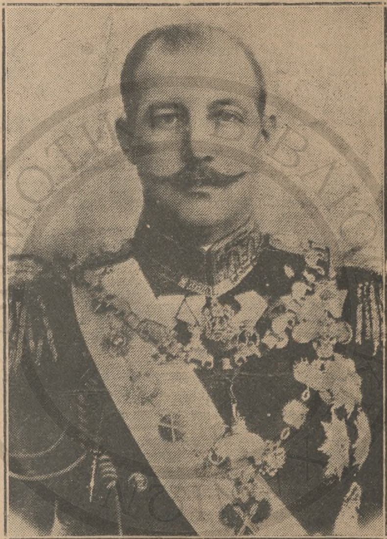
Ὁ πρίγκηψ Γεώργιος, ὅπως ἦτο κατὰ τὴν ἐποχὴν τῆς ρῆξεως με- τὲν Βενιζέλου