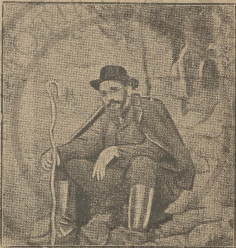
Μία ἀνέκδοτος φωτογραφία τοῦ Βενιζέλου ὡς ἐπανακατάτου εἰς τὸ Θερίσιον τῆς Κρήτης.

»Νομίζομεν δὲ, ὅτι δὲν παρκαγωνίζομεν τὴν πρόθεσιν τοῦ πλάσαντες τὰς δηλώσεις ταύτας, ὑποθέτοντες πρῶτιστως, ὅτι δι' αὐτῶν ἐπρέκειτο νὰ σημανθῇ, ὅτι αἱ πολιτικαὶ ἐκεῖναι ἰδέαι τοῦ κ. Βενιζέλου ἠμπόδισαν τὴν ἔνωσιν, ἥτις κατὰ τὰς «αὐθεντικὰς» τῆς ἐποχῆς ἐκείνης θεθαίωσις καὶ τοῦ δημοσιευγραφικοῦ ὄργανου τοῦ κ. ἰδιαιτέρου