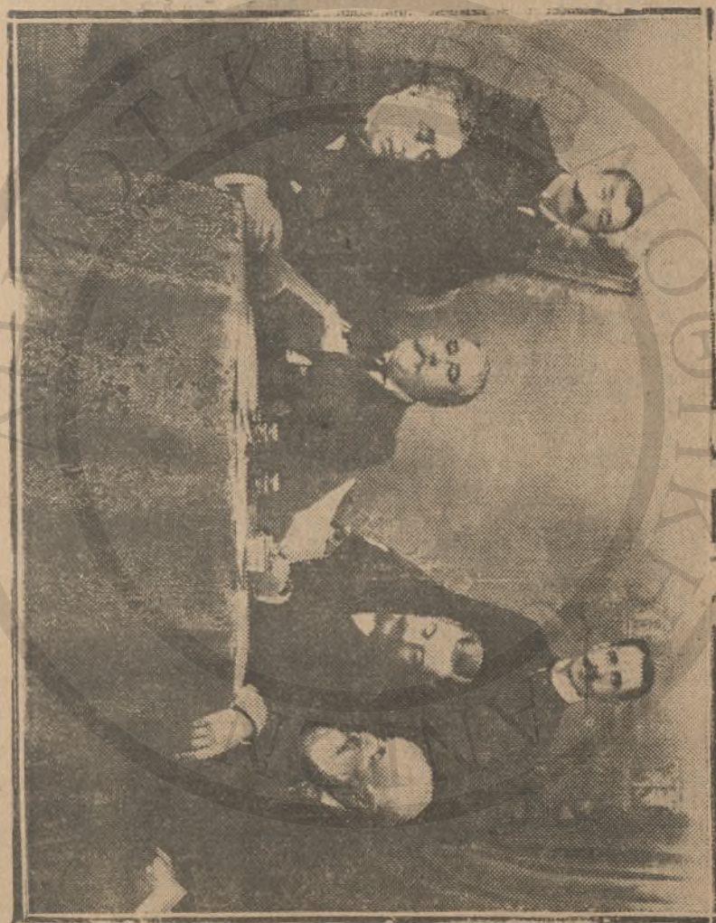
Ἡ κατελευθεωθεὶς εἰς Κρήτην ἐπιτροπὴ τῶν ἀντιπροσώπων τῶν 4 Δυνάμεων διὰ νὰ ἐξετάσῃ τὰ αἰτήματα τῶν Θεριστιανῶν.

πρόθεσις τοῦ ἐν λόγῳ κρότου πρόποι νὰ συνδυασθῇ πρὸς ἑακ ἀδημοσιεύθησαν ἐν τῷ φύλλῳ τοῦ « Ἀστραὶς » τῆς 6 Μαρτίου καὶ πρὸς τὴν ἐν τῷ φύλλῳ τῆς 18 Μαρτίου τῆς αὐτῆς ἡμερησίδος ἀνοικύρηται ἑκα-