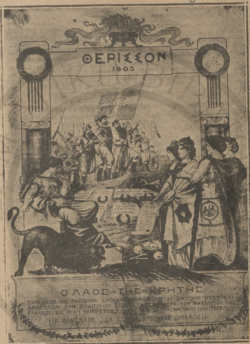
Μία παραστατική λιθογραφία ερμηνεύουσα τὰς ἐπιδιώξεις τοῦ κρητικῆς λαοῦ. Ἐκυκλοφόρησεν εὐρύτατα κατὰ τὸ 1905.