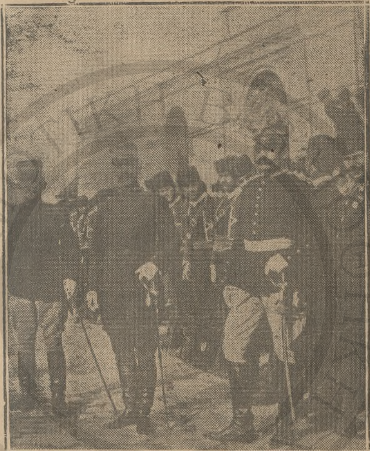
Τ' ἀποτελέσματα τοῦ κινήματος τοῦ Θερσίου : Οἱ Ἕλληνες ἀξιο- ιατικεῖ οἱ ὅποιοι κατῆλθεν εἰς τὴν Κρήτην μετὰ τὸ κίνημα δι- τὴν ὀργάνωσιν τῆς ἐντοπίου χωροφυλακῆς.

τοῦ πρίγκιπος κατέστη ἀδύνατος, ἀδύνατος ἀπέβη καὶ ἡ λειτουργία παγ- τὸς προσωρινοῦ καθεστώτος ἐν Κρήτῃ, ἀφοῦ ὁ ἐπιρισμὸς εἰς ἀντικατά- στασιν Αὐτοῦ ξένου Κυβερνήτου ἀδύνατον εἶνε γὰρ γίγνη ἀνεκτὸς ὑπὸ τοῦ Κρητικοῦ λαοῦ, ὡς δηλοῦμεν καὶ διὰ τοῦ τελευταίου πρὸς τὰς Δυ- νάμεις ὑπομνήματός μας. Ἀδύνατον ἐπαμείνων εἶνε δι' ἡμᾶς γὰ ἀκο-