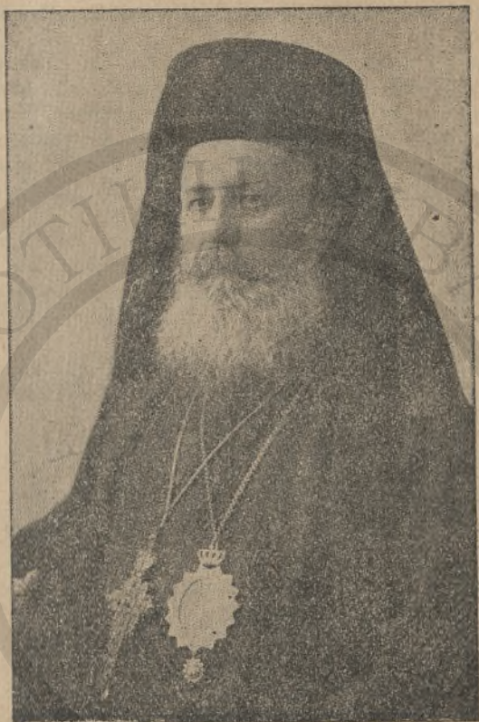
ΕΥΔΟΚΙΜΟΣ ΣΥΓΓΕΛΑΚΗΣ ΕΠΙΣΚΟΠΟΣ ΚΙΣΣΑΜΟΥ ΚΑΙ ΣΕΛΙΝΟΥ

Ἐξορισθεὶς ὑπὸ τῶν Γερμανῶν ὁ Κισσάμου καὶ Σελίνου, ἀφοῦ πρὸ διετίας τὸν ἐκράτησαν ἐπὶ πολὺ ἐν ταῖς φυλακαῖς Ἀγιάς, εἰς Ἀθήνας, παραμένει ἐκεῖ καὶ συνεχίζει τὸ ὑψηλὸν ἀνθρωπιστικὸν καὶ ἀλτροῦστικὸν καθῆκον του. Δὲν κάθεται ἥσυχος, οὔτε σχεδὸν κοιμᾶται, οὔτε ὡς Ἐπίσκοπος ἔχει τὰς ἀναπαύσεις του καὶ καλοπέρασιν ἐν τῇ πρωτευούσῃ, ἀλλὰ διαρκῶς κινεῖται, ζητᾷ ἀπαιτεῖ ὑπὲρ τῶν ἀπόρων καὶ πασχόντων τοῦ ποιμνίου του ἐν Κρήτῃ, καθὼς καὶ πασχόντων καὶ δυστυχούντων καὶ ἀλλαχοῦ. Ἀπὸ πλουσίους καὶ εὐποροῦντας, ἀπὸ συλλόγους, ἀπὸ τὴν Κυβερνησιν ἢ Ἐρυθρὸν Σταυρὸν συλλέγει ροῦχα, κουβαρίστρες, βαμβάκι, κεφαλοκαλύμματα γυναικεῖα