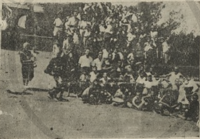
Αγόρια και κορίτσια της τρίτης κατασκηνωτικής περιόδου

Εκείνο έτος που δεν μπόρεσε να κάνει σε μεγάλη έκταση, όπως ήθελε και όπως ήταν ανάγκη, στα χρόνια της σκλαβιάς, το κατώρθωσε στο πρώτο ελεύθερο καλοκαίρι. Με μεγάλους κόπους και τωράστια επιμονή, αξιόθικη επί τέλους το καλοκαίρι αυτό να δη την ολοκληρωτική εκπλήρωσι ενός θερμού πόθου της, την επίτευξι ενός υψηλού ονείρου της: Την ίδρυσι δικής της κατασκηνώσεως. Κατασκηνώσεως, που ελειτούργησε με τις καλύτερες προϋποθέσεις, θα μπορούσε να πη κανείς, χωρίς, εκτός των άλλων παραγόντων, και στην ένισχυσι του 'Υπουργείου Κοινωνικής Προνοίας. 'Η κατασκήνωσις στεγάσθηκε μέσα σε δύο χαριτωμένες βιλ-