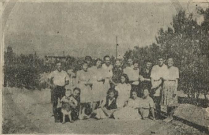
Τὰ στελέχη τῶν κατασκηνώσεων τῆς Κ. Α.

μέ την πλούσια ἀσφαλῶς τροφή τους, τὸν καθαρὸ ἀέρα τοῦ βουνοῦ, τὸ ὀξυγόνο τῶν πεύκων, τὴν χαρὰ τοῦ χαρίζει ἡ φύσις καὶ τὸ ὑπαιθρο, μακριὰ ἀπὸ τὴν μιζέρια καὶ τὴν γκρίνια τοῦ σπιτιοῦ, μακριὰ ἀπ' τοὺς μύριους κινδύνους (ὕγεινους καὶ ψυχικούς) τῆς πόλης, μακριὰ ἀπὸ τὶς πρόωρες σκοτούρες τῆς βιοπάλης, γιὰ πολλὰ, τὰ ἔκαναν νὰ φύγουν με γελαστὰ καὶ ζωηρὰ πρόσωπα, με προδοκόκκινα μάγουλα, με ζωντανὴ καὶ σπινθηροβόλα ματιά καὶ γενικά με γερότερα καὶ πιὸ δεμένα κορμιά, ἴσως ἀποδεικνύουν καὶ οἱ ἱατρικὲς ἐξιτάσεις καὶ αἱ στατιστικὲς διαφορὰς βάρους, ὕψους καὶ στήθικης περιμέτρου (κατὰ μέσον ἔβρον ἐπάχυναν 2 ὀκάδες καὶ ἡ στήθική τους περίμετρος ἀεξήθηκα κατὰ 4 πόντους). Μὰ ἐκεῖ, πού δὲν θὰ ἦταν ὑπερβολὴ ἂν λέγαμε, κυρίως, ὠφελήθησαν, μ' ὄλο πού τὸ διάστημα τῶν 22 ἡμερῶν φαίνεται μικρὸ, εἶναι ἡ ψυχὴ τους, ὁ συναισθηματικὸς γενικά κόσμος τους. Ἦρθαν ἀγνωστα σχεδὸν