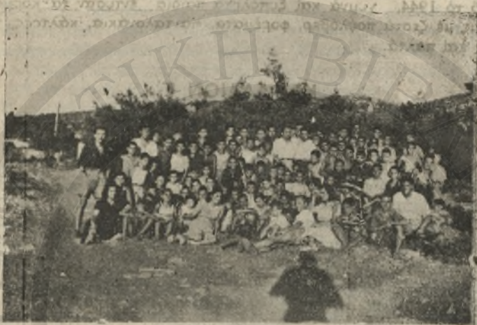
Ἔργοι τῆς πρώτης κατασκηνωτικῆς περιόδου.

Δυστυχῶς ὅμως ἡ «Κρητικὴ Ἀλληλεγγύη» ἔστ' ἰσχύει τῶν μέ- σων γιὰ νὰ διοργανώσῃ ξεχωριστὴ δική της κατασκήνωσι γιὰ τῶν