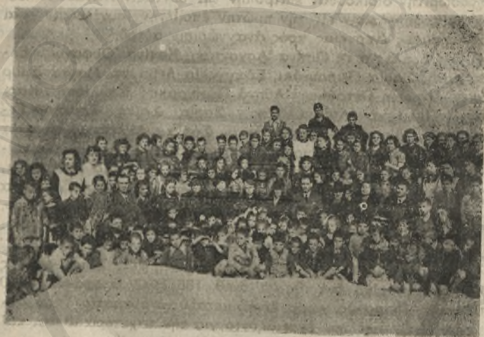
Τὰ παιδιά τοῦ παιδικοῦ συσσιτίου τῆς Κ. Α. με τὸ πρῶτο Δ. Σ. Φεβρουάριος 1943

της για να παρουσιασθῆ τυπικά και νομικά τὸ Σωματεῖον μας, ἐκινήθηκε με ὅλη τὴ δύναμι τῆς ψυχῆς τῶν μελῶν της γιὰ τὴν ἴδρυσιν, ὄργανωσιν καὶ λειτουργίαν τοῦ παιδικοῦ συσσιτίου, πού ἐτέθη ὡς πρωταρχικός σκοπὸς τῆς προσπάθειάς μας. Διαβήματα, παρακλήσεις, πιέσεις, ἀπαιτήσεις καὶ πάσης φύσεως ἐνέργειαι ἐγίνοντο νύκτα καὶ ἡμέρα πρὸς ὅλας τὰς κατεχόμενους. Ἐτσι, με σκληροὺς ἀγῶνας, καταβροῦσαμε νὰ πάρουμε τὴν ἔγκρισιν, νὰ βροῦμε τὸ οἶκημά, νὰ συγκεντρώσουμε τὰ ἐπιπλά καὶ τὰ σκεύη καὶ ὅ,τι ἄλλο χρή-