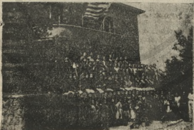
Κορίτσια τῆς δευτέρας κατασκηνωτικῆς περιόδου

Κρητικόπουλα στὰ χρόνια τῆς σκλαβιάς. Οἱ οἰκονομικοὶ τῆς πόρῃ ἔμπροστὰ στὶς ἀπείρες ἀνάγκες πού εἶχε νὰ θεραπεύσῃ, ἦταν ἐλά-