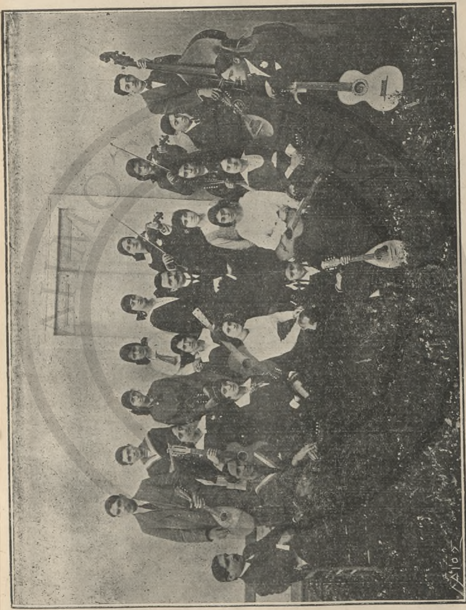
ΤΑ ΜΕΛΗ ΤΗΣ ΜΑΝΔΑΛΙΝΑΤΑΣ ΤΟΥ ΣΥΝΔΕΣΜΟΥ ΤΩΝ ΦΙΛΟΜΟΥΣΩΝ