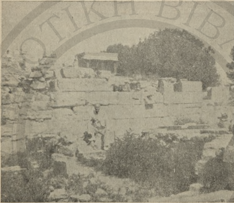
Τὰ ερεῖπια τοῦ ἀνακαλυφθέντος ὑπὸ τοῦ Evans εἰς τὴν Κνωσὸν παλαιότερου Σχολείου τῆς Εὐρώπης.

τοῦ ὁποίου εὐρέθησαν εἰς ἀλληπαλλήλους σειρὰς τὰ ἐδώλια τῶν μαθη- τῶν, ἐνῶ ἀπέναντι ὑπῆρχε κἀθισμα, διδασκάλου προφανῶς, καὶ παρ' αὐτὸ ἐπὶ μικρῶν κιονίσκων κατάλληλοι κοιλότητες, ἵνα μαλάσσεται ὁ πηλὸς καὶ κατασκευάζονται αἱ πινακίδες, ἐφ' ὧν ἐχαράσσοντο τὰ γράμματα (κατὰ τὴν ἐποχὴν τῶν κτισμάτων τούτων ἐδιδάσκετο τὸ πρῶ- τον σύστημα τῆς γραμμικῆς γραφῆς). Τὸ σχολεῖον τοῦτο τοποθετεῖται