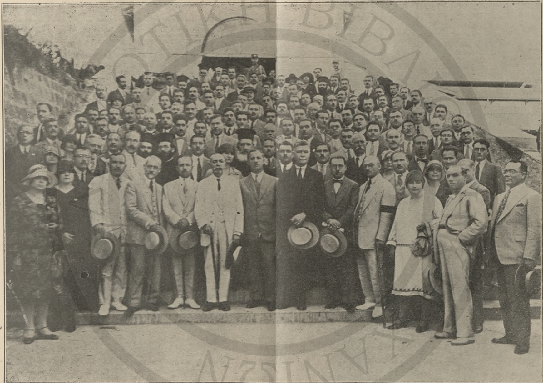
Οι Λειτουργοὶ τῆς Μ. Ἐκπαιδεύσεως μετὰ τὴν λήξιν τοῦ Παιδαγωγικοῦ Συνεδρίου