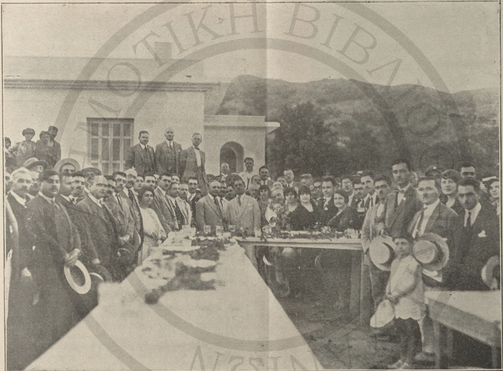
Ὁ κ. Γεν. Διοικητὴς μετὰ τῶν μελῶν τοῦ Παιδαγ. Συνεδρίου ἐν Ἀγιᾷ