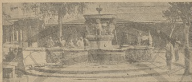
Τό Συντριβάνι. (Ἐνετική κρήνη Μοροζίνη)

ἀγά, πού ἦταν κοντά στο Βαλιδέ τζαμί. Ἐκεῖ παράγγειλε καβέ καί ναργιλέ καί περίμενε νάρθη ἢ ὥρα πού θά πήγαινε στής Ἀριάδνης.