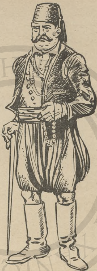
‘Ο Ρεμαντάν μπής

‘Αποφάσισε τότε νά τό ξεμυστηρευτεί στό Φουντούλη και στό Μίνωα ίσως τοΰδιναν καμμιά συμβουλή κι’ αύτοί. Οι φίλοι του προσπάθησαν νά τόν άποτρέψουν άπό τόν άνώμαλο αύτό έρωτα, μά δέν τά κατάφεραν. Δέν ήξεραν όμως με τί τρόπο νά τόν βοηθήσουν.