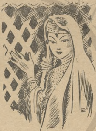
Ἡ Γιουλτέρ χανούμ

Ἀνέβηκε ἀργὰ στὸν ὄντα ὅπου βρῆκε τὸ Μουσταφᾶ μονάχο νὰ διαβάζῃ καὶ ἄρχισε νὰ κόβῃ βόλτες ἐπάνω κάτω ἀμίλητος. Ὁ Μουσταφᾶς πού ἦταν συνηθισμένος πάντα νὰ τὸν βλέ-