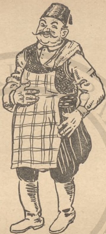
Ὁ Σαλιῆ ἀγάς

Τὰ «ραμαζά- νια», μόλις νύ- χτωνε καὶ ἀνα- βαν τὰ καντή- λια στοὺς μινα- ρέδες — τὸ καν- τίλ γκεγκεσί—ἡ πολιτεία ἀντι- λαλοῦσε τίς φω- νές τῶν ἱμάμη- δων, πού ἀτε- λειώτες ἀκούό- τανε σὲ ὄλους τοὺς τόνους τῆς μουσικῆς κλίμα- κας. Τότε τελει- ωνε ἡ νηστεία τῆς ἡμέρας καὶ οἱ Τοῦρκοι μὲ ἀ- ληθινὴ βουλιμία ἔπεφταν στὸ φαί- στὰ σπίτια τους καὶ στὰ τούρκι- κα μαγεριά—τὰ τσατσίδικα — ὅπως τ'άλεγαν καὶ ξεχύνονταν ἕστερα στὰ κα- φενεῖα καὶ στὰ κέντρα ὅπου ξε-