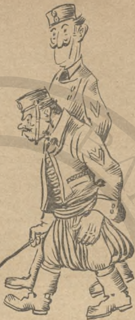
Ὁ Μιχαλάκης ὁ Κατσά - Κατσᾶς

— Ἄστο δά! κι' αὐτὸ δά δείξη! εἶπε γελώντας ὁ Λευτέρης.