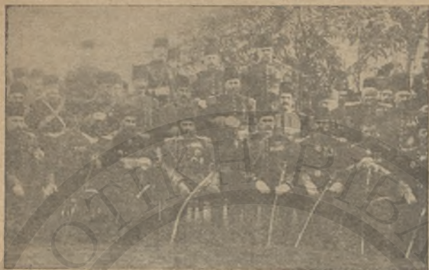
Οἱ τελευταῖοι Τούρκοι ἀξιωματικοὶ ποὺ ἔφυγαν ἀπὸ τὸ Κάστρο.

βαίνεις, μπέη μου, πόσο δά μοῦ κοστίζει καὶ ὁ χωρισμὸς τοῦ παιδιοῦ μου καὶ ἴντα παράδες ἔχω νά ξεοδέψω. Μὰ ἄνε τον ἀφήσω στήν Ἀθήνα, εἶναι κοντά ἢ Κρήτη καὶ εἶναι εὐκόλο ἢ λαύρα τοῦ σεβντά τως νά φτάνει τὸν ἕνα στὸν ἄλλο. Ἡ Ἀγγλία ὅμως εἶναι ἀλάργο. Ἰντα λές καὶ τοῦ λόγου σου;