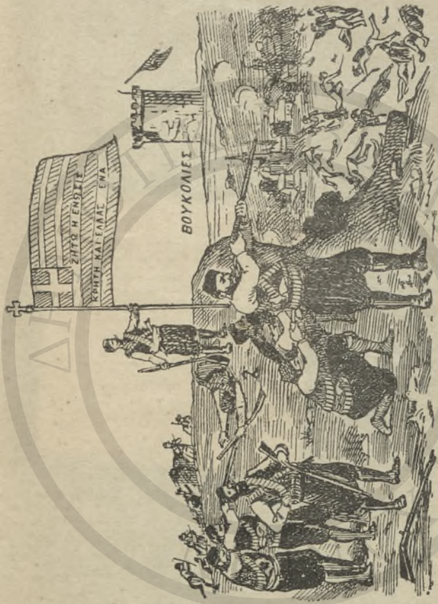
1) Γεώρ. Μεγανάκης (όπλαρχηγός), 2) Γ. Κουμής ή Μπετζερίκος φονευθείς σηματοφόρος του,